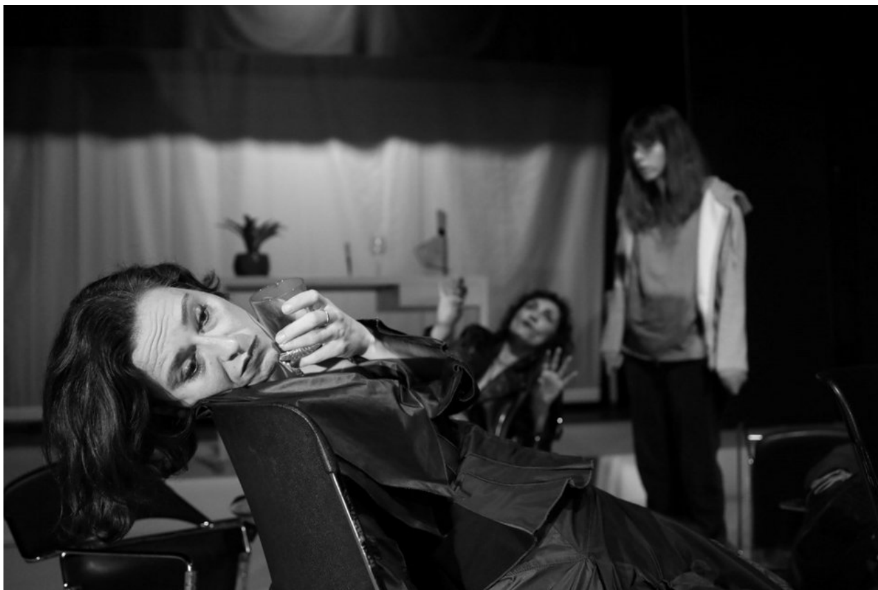
«154 Bertha», της Έλσας Ανδριανού