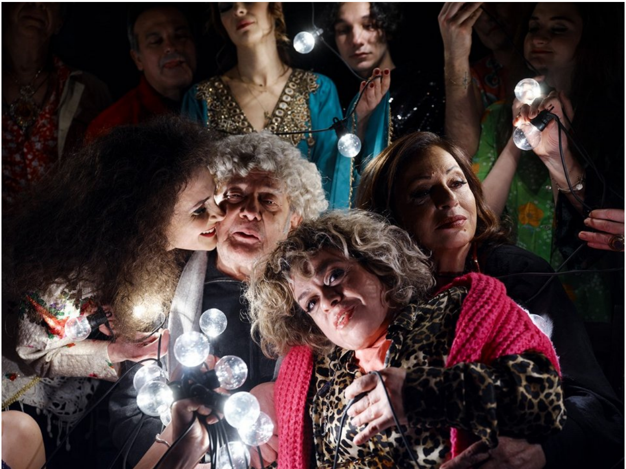
«Μια νύχτα στην Επίδαυρο» από το Εθνικό θέατρο

Με ένα άκρως έξυπνο κείμενο και γραφή γεμάτη χιούμορ και ευαισθησία, ο Ρόλαντ Σιμελπφένιχ κατορθώνει να αποτυπώσει το σύγχρονο πολιτικοκοινωνικό γίγνεσθαι, σχολιάζοντας όλες της πληγές του δυτικού κόσμου, παρουσιάζοντάς μας την εικόνα μιας φθαρμένης Ευρώπης που λίγο-λίγο φτάνει στη δύση της. Ο «ΧΡΥΣΟΣ ΔΡΑΚΟΣ» είναι ένα βαθιά πολιτικό έργο που καταπιάνεται με τις ανθρώπινες σχέσεις, τη βία, τη μετανάστευση, το trafficking και την ανάγκη μας για επιβίωση. Το παζλ της ιστορίας συντίθεται μέσα από έναν καταγιστικό ρυθμό, παραγγελίες εξωτικών φαγητών και καυστικό χιούμορ. Στο κέντρο της ιστορίας ένας παράνομος νεαρός Κινέζος που υποφέρει από πονόδοντο και η χαμένη μικρή αδελφή του που, χωρίς να το γνωρίζει, ζει μερικά πατώματα μακριά του. Τι συμβαίνει κι έχουμε πάψει πια να ακούμε ο ένας τον άλλον; Γιατί οι ανθρώπινες σχέσεις καταρρέουν; Γιατί είμαστε τόσο απομονωμένοι;