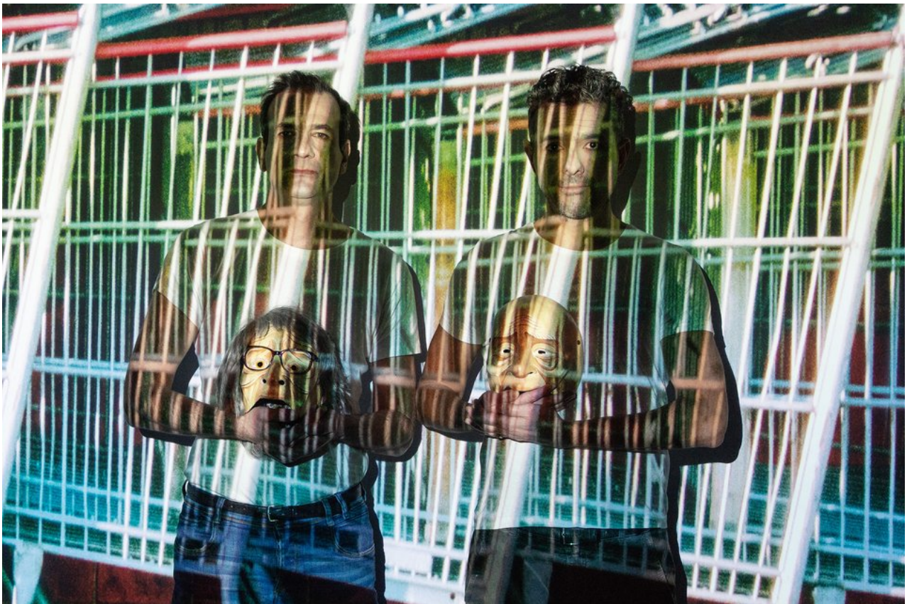
ΚΘΒΕ, «Big in Japan»