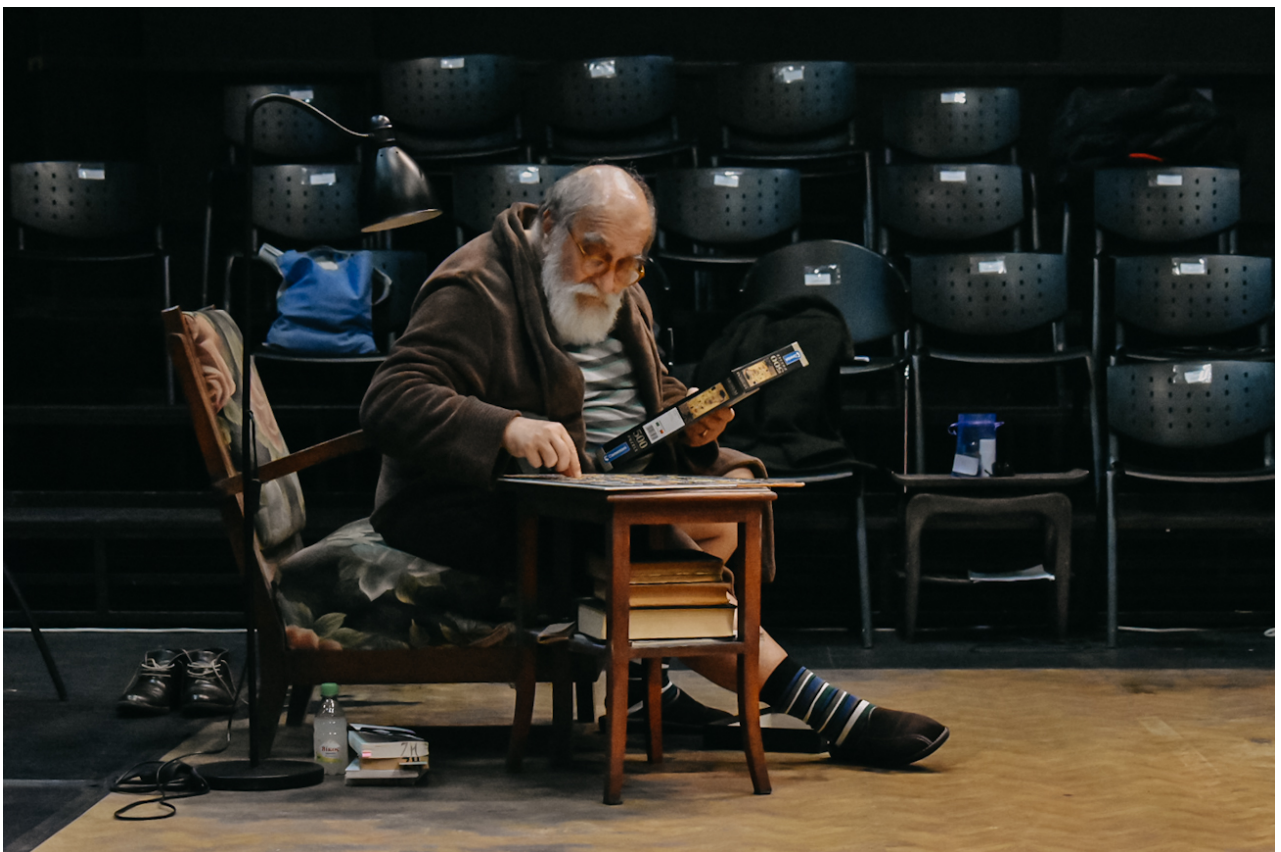
*Κεντρική φωτογράφιση: That long black cloud