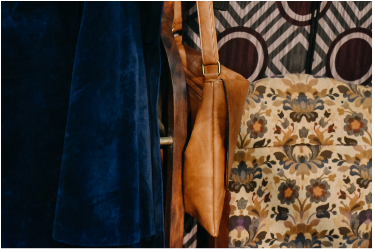
Φωτογραφίες για την Parallaxi: Δήμητρα Κυπριώτη