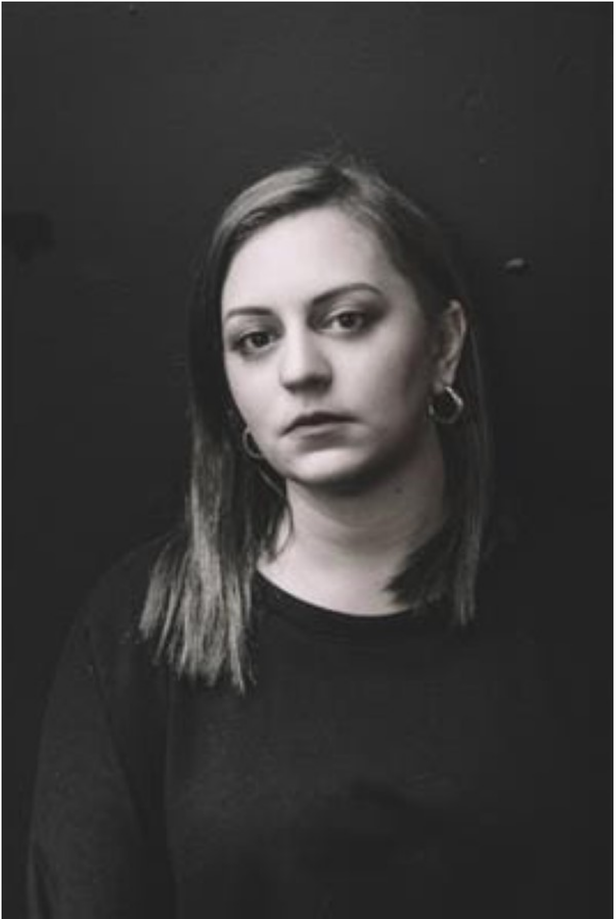
THESSNA ... , ΣΥΝΕΝΤΕΥΞΕΙΣ By ΚΑΤΕΡΙΝΑ ΧΑΤΖΗΚΩΝΣΤΑΝΤΙΝΟΥ 22