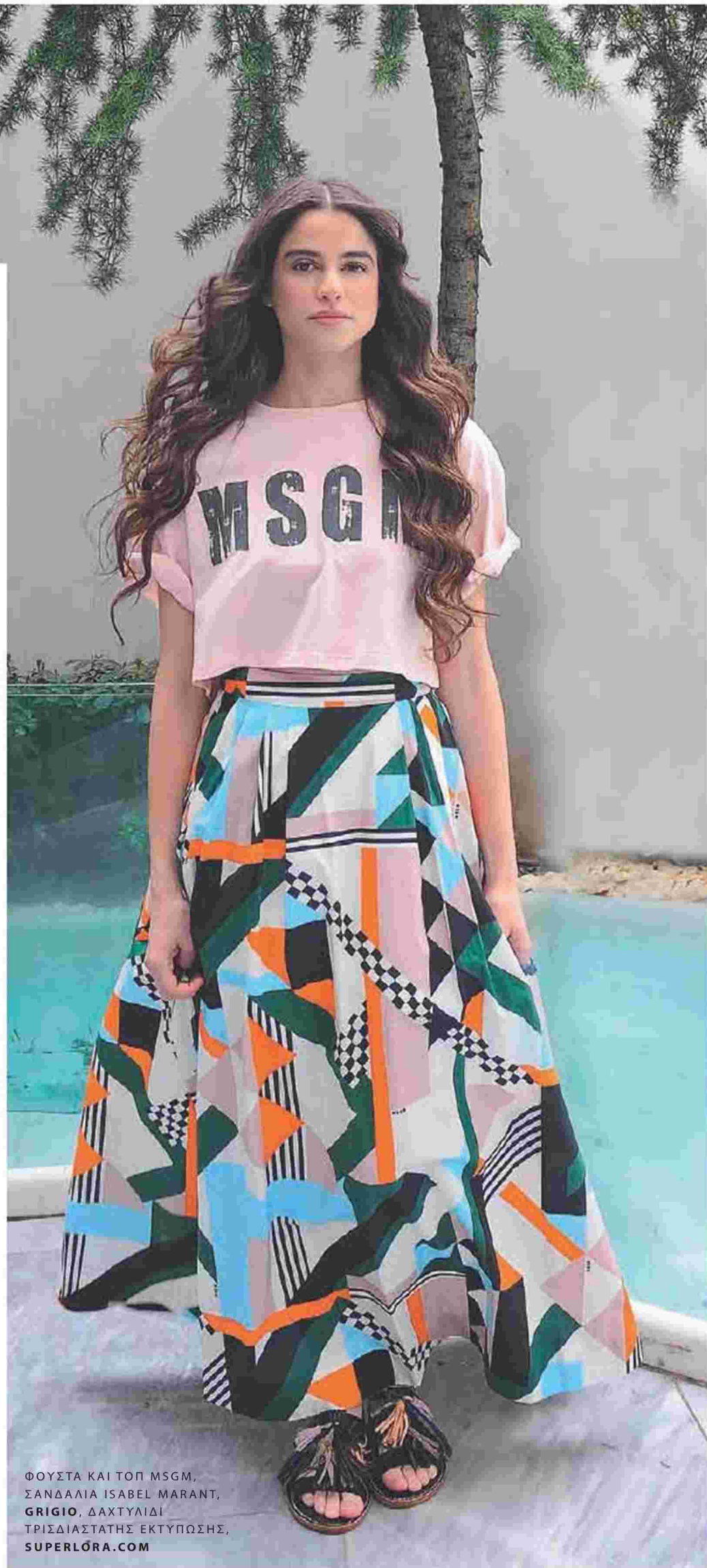
ΦΟΥΣΤΑ ΚΑΙ ΤΟΠ MSGM, ΣΑΝΔΑΛΙΑ ISABEL MARANT, GRIGIO, ΔΑΧΤΥΛΙΔΙ ΤΡΙΣΔΙΑΣΤΑΤΗΣ ΕΚΤΥΠΩΣΗΣ, SUPERLORA.COM

Το γεγονός ότι φαίνεσαι μικρότερη από την ηλικία σου νιώθεις ότι σε περιορίζει αναφορικά με τους ρόλους που καλείσαι να ερμηνεύσεις;