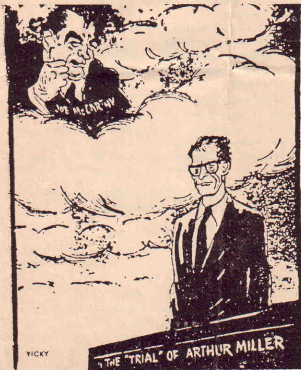
Στὴ δικὴ τοῦ Ἄρθουρ Μίλλερ. «Ποιὸς εἶπε πὼς πέθανε, εἶ»