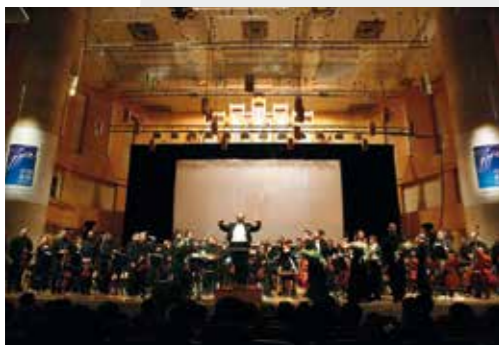
14 Δεκεμβρίου 2007 Η ΚΟΘ στο Πεκίνο