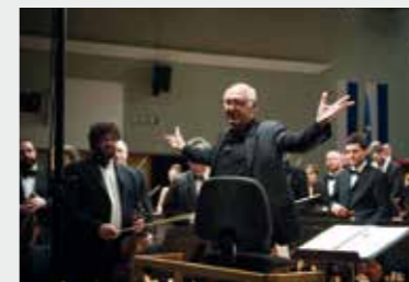
21 Μαρτίου 2014 Ο Michael Nyman με την ΚΟΘ