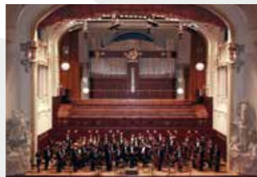
24 Απριλίου 2009 Η ΚΟΘ στη Πράγα