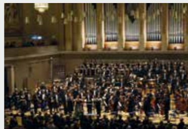
10 Μαρτίου 2017 Η ΚΟΘ στο Μόναχο