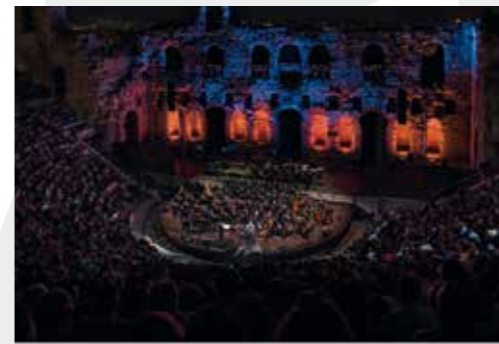
8 Σεπτεμβρίου 2018 80 χρόνια Μάνος Λοιζος στο Ηρώδειο