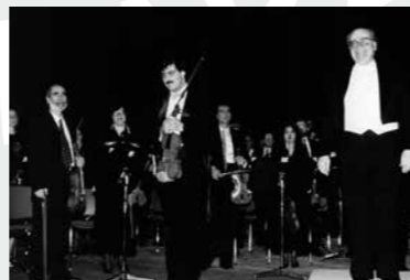
Λεωνίδας Καβάκος - Κοσμάς Γαλιλαίας