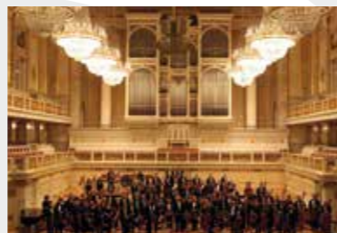
12 Οκτωβρίου 2010 Η ΚΟΘ στο Βερολίνο