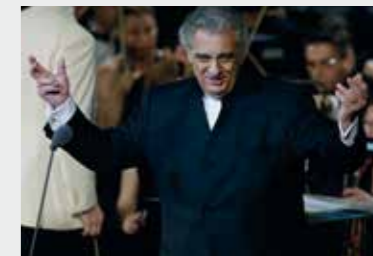
15 Ιουνίου 2005 Ο Plácido Domingo με την ΚΟΘ στο Ηρώδειο