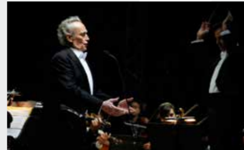
7 Σεπτεμβρίου 2009 Ο Jose Carreras με την ΚΟΘ