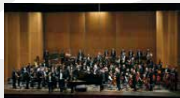
17 Νοεμβρίου 2009 Η ΚΟΘ στη Φλωρεντία με τον Aldo Ciccolini