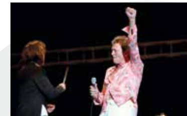
30 Ιουνίου 2007 Συμφωνικό ροκ με τον Ian Gillan