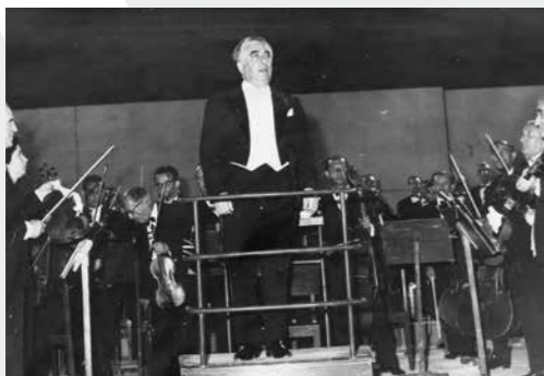
Ο Αράμ Χατσατουριάν με την ΚΟΘ