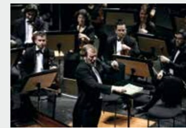
8 Δεκεμβρίου 2006_Ο Maxim Shostakovich διευθύνει την ΚΟΘ σε έργα του πατέρα του