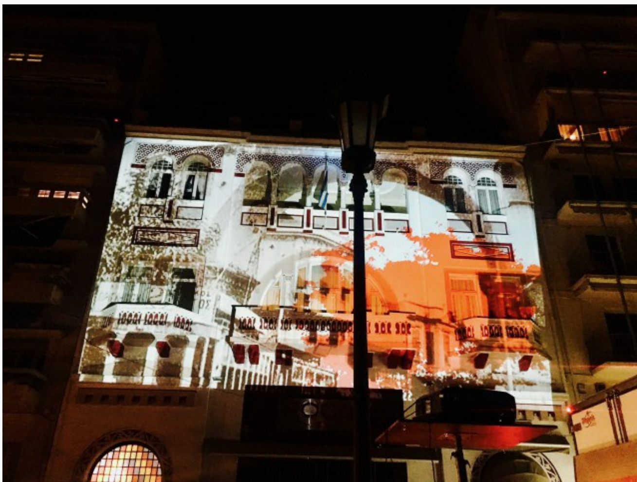
Φωτογραφία από την πρόβα

Εκείνη η 5η Αυγούστου του 1917 (με το παλιό ημερολόγιο) δεν είχε καμιά διαφορά από τις προηγούμενες: παραμονή του Σωτήρος και ο πληθυσμός της Πάνω Πόλης ετοιμαζόταν πυρετωδώς για το τοπικό πανηγύρι μέχρι μια σπίθα να ανάψει κάπου κοντά στην πλατεία Μουσχουντή και να γίνει πυρκαγιά. Η φωτιά προξενεί ανυπολόγιστες υλικές ζημιές, η πόλη παρόλ' αυτά δε θρηνεί ανθρώπινα θύματα. Πληθυσμοί εκτοπίζονται από το ιστορικό κέντρο ενώ έξι κιόλας μέρες μετά τη φωτιά συστήνεται επιτροπή για την ανοικοδόμηση μιας νέας πόλης σύμφωνης με το όραμα της νέας πραγματικότητας που διαφαίνεται. Πώς, όμως, ξεκίνησε η φωτιά και πώς κατάφερε να κάψει ένα τόσο μεγάλο κομμάτι της πόλης; Λέγεται ότι υπεύθυνη ήταν μια νοικοκυρά της Άνω Πόλης που τηγάνιζε μελιτζάνες. Σε δίκη που έγινε λίγο μετά, όμως, αυτή αθωώνεται πανηγυρικά, η πόλη ανοικοδομείται και η σύσταση του πληθυσμού της αλλάζει ριζικά μέσα στα χρόνια που ακολουθούν. Εκατό χρόνια μετά, η καλλιτεχνική κολλεκτίβα influx δημιουργεί δύο εστίες θεατρικής δράσης. Η πρώτη –μια site-specific θεατρική παράσταση βασισμένη σε ντοκουμέντα της εποχής και κείμενα του Σάκη Σερέφα, στην πλατεία Μουσχουντή, εκεί όπου ξεκίνησε η φωτιά – παρακολουθεί τη ζωή της γειτονιάς, λίγο πριν ξεσπάσει η φωτιά και τις πρώτες στιγμές, όταν οι προετοιμασίες για το πανηγύρι διακόπτονται βίαια και μετατρέπονται σε άτακτη φυγή προς τη θάλασσα.