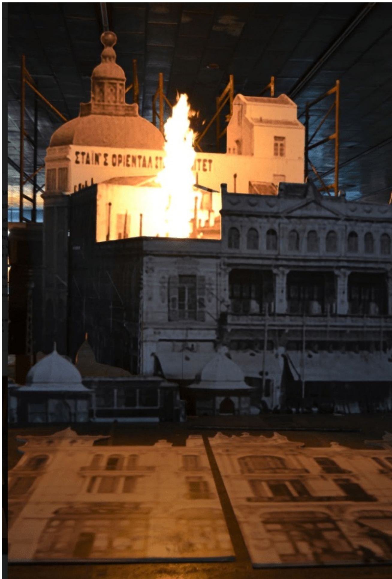
Το Σάββατο 23 Σεπτεμβρίου, στις 9 και μισή το βράδυ, στην πλατεία Αριστοτέλους πρόκειται να γίνει μια αναπαράσταση της καύσης του θαλάσσιου μετώπου της πόλης κατά τη διάρκεια της Πυρκαγιάς του 1917.