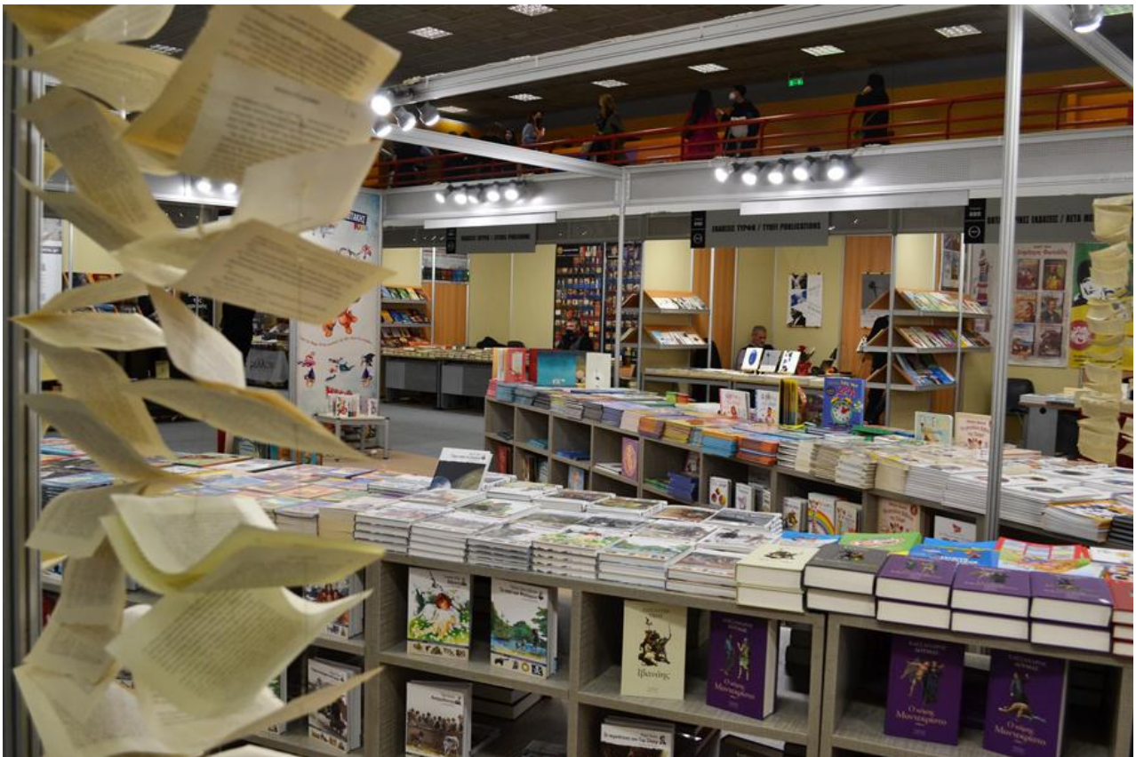
Εικόνα: Νόπη Ράντη

Το Ελληνικό Ίδρυμα Πολιτισμού διοργανώνει την 20η Διεθνή Έκθεση Βιβλίου Θεσσαλονίκης στις εγκαταστάσεις της Δ.Ε.Θ στις αρχές του Μαΐου 2024 με εκδοτικούς οίκους από την Ελλάδα και το εξωτερικό, συγγραφείς, ομιλίες και μία ευκαιρία για αναγνώστες και ανθρώπους του βιβλίου να συναντηθούν και να μοιραστούν γνώσεις.