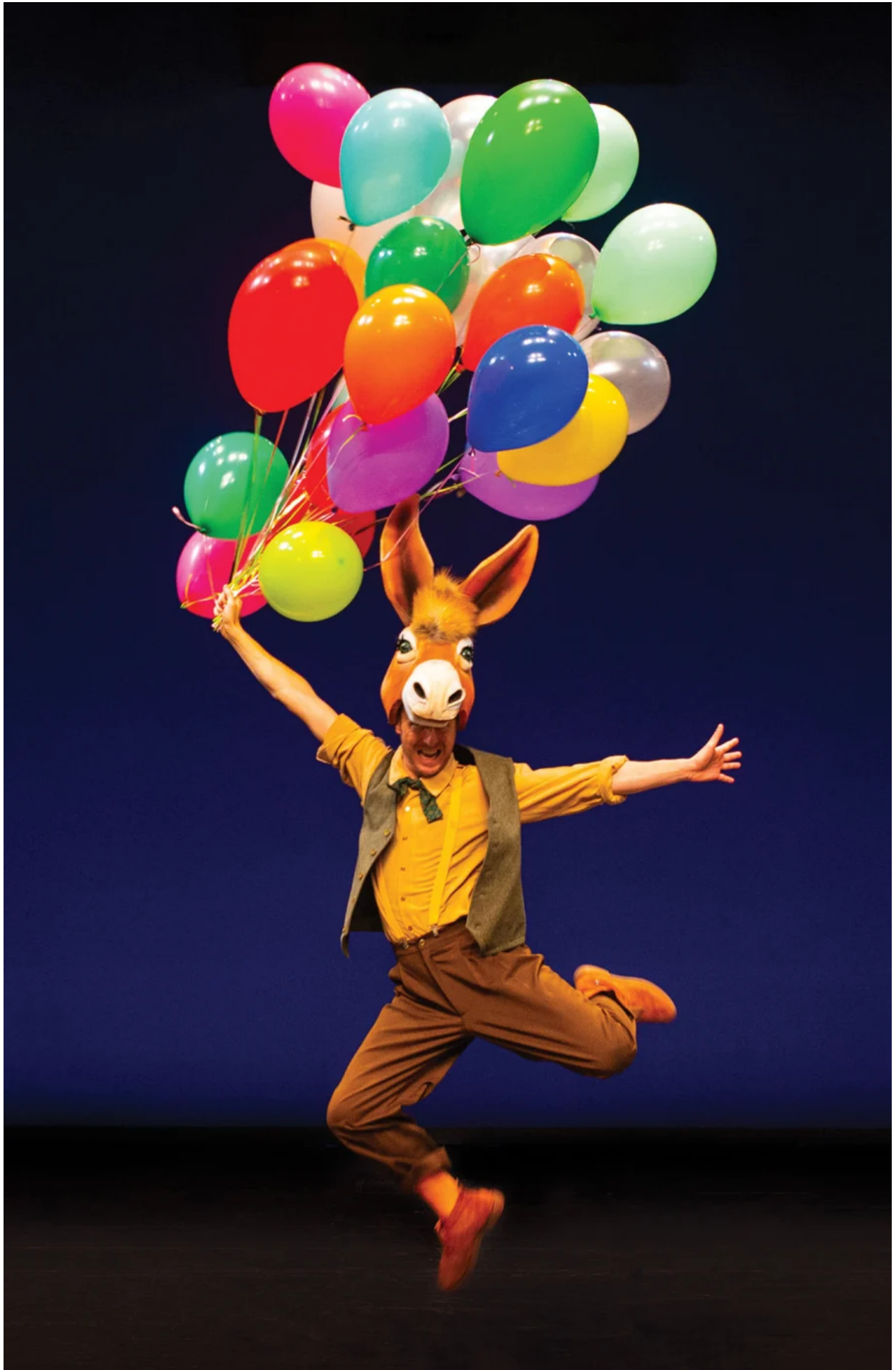
Γκάρης, το μιούζικαλ