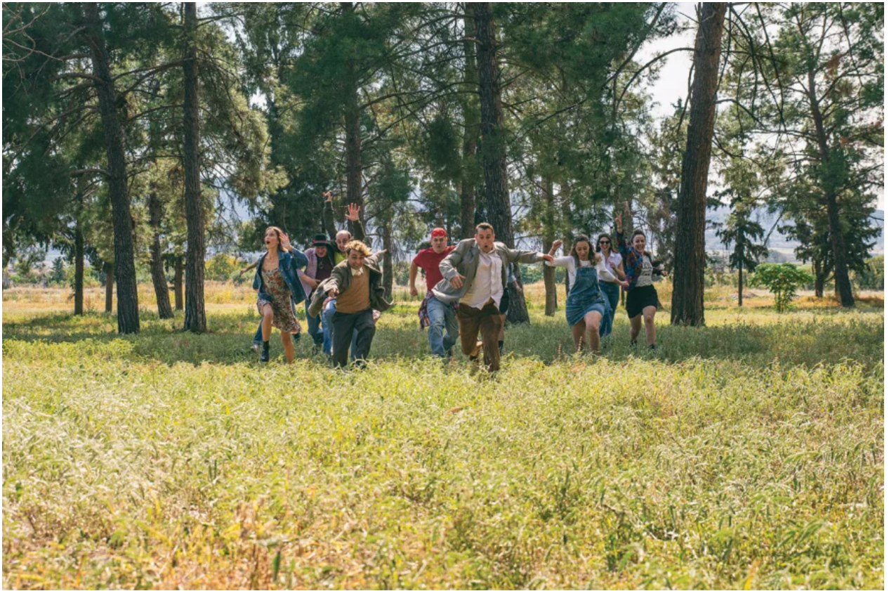
Τα τρελά βατράχια