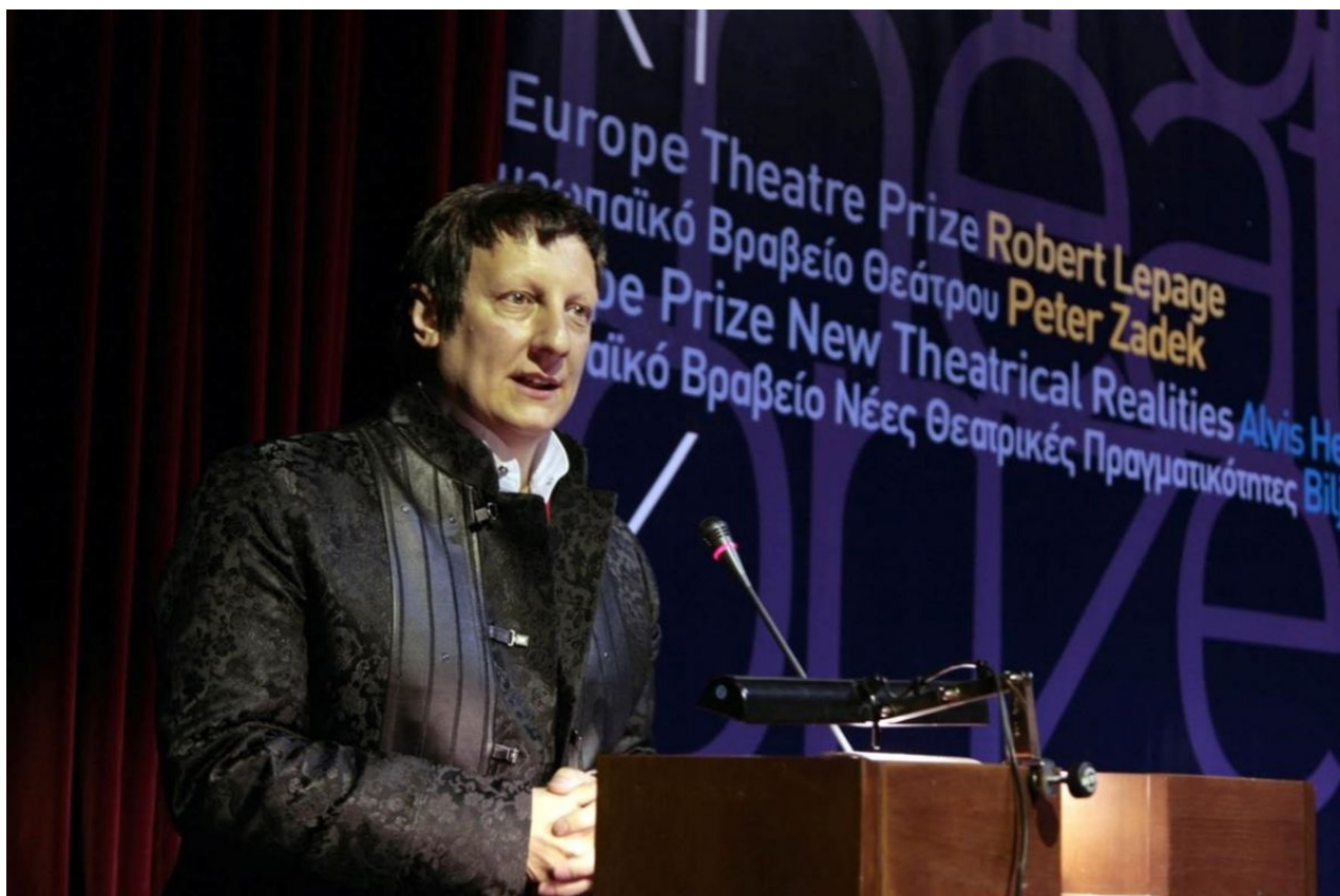
Robert Lepage

Το καλοκαίρι του 2007, μια άλλη μεγάλη διοργάνωση πραγματοποιείται από το ΚΘΒΕ σε συνεργασία με το Υπουργείο Πολιτισμού, το 1ο Φεστιβάλ Θεάτρου Νοτιοανατολικής Ευρώπης . Σημαντικοί καλλιτέχνες, σκηνοθέτες, ηθοποιοί, συμμετείχαν στις « όψεις του αρχαίου δράματος », φέρνοντας μέσα από τη δική τους ματιά συνολικά οκτώ παραστάσεις από οκτώ χώρες –Τουρκία, Ρουμανία, Σερβία, Σλοβενία, Ουγγαρία, Ελλάδα, Αλβανία και Κύπρο– στο θεατρόφιλο κοινό της πόλης.