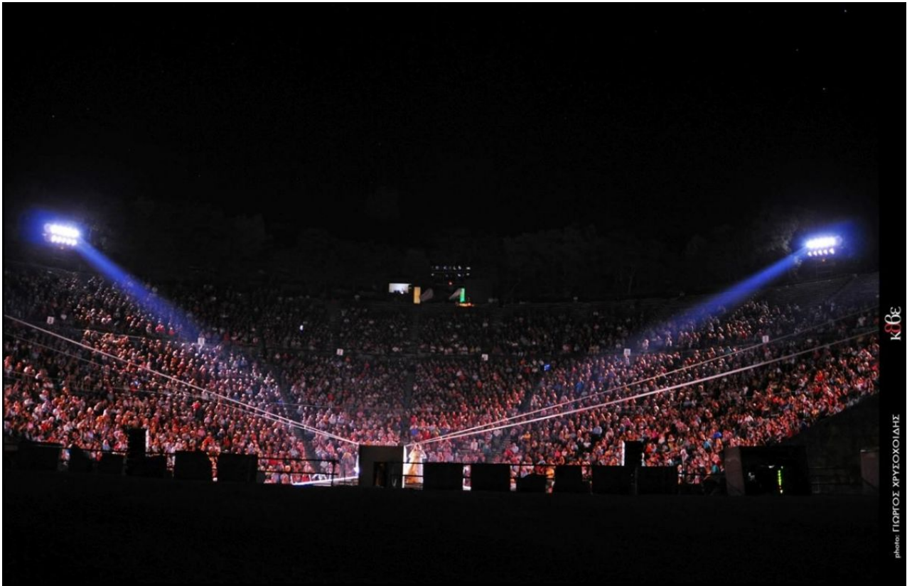
Αρχαίο Θέατρο Επιδαύρου

Η σημαντικότερη όμως όλων των παραστάσεων, που σφράγισε την εποχή Βολανάκη στο ΚΘΒΕ, ήταν η «Μήδεια» του Ευριπίδη με πρωταγωνιστές τη Μελίνα Μερκούρη και τον Δημήτρη Παπαμιχαήλ. Πολιτικές καταστάσεις δεν επιτρέπουν στη Μελίνα Μερκούρη να παίξει στην Επίδαυρο. Η παράσταση κάνει πρεμιέρα το καλοκαίρι του 1976 στο Φεστιβάλ Φιλίππων. Στη Θεσσαλονίκη παρουσιάζεται στο ανακατασκευασμένο θέατρο Δάσους.