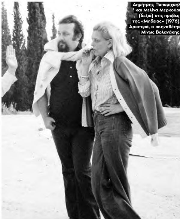
Δημήτρης Παπαμιχαήλ και Μελίνα Μερκούρη (δεξιά) στις πρόβες της «Μηδείας» (1976). Αριστερά, ο σκηνοθέτης Μίνως Βολανάκης.