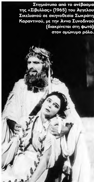
Το πρώτο κρατικό θέατρο Θεσσαλονίκης Στην πραγματικότητα, το ΚΘΒΕ δεν έχει ζωηρό μόνο 58 χρόνων,