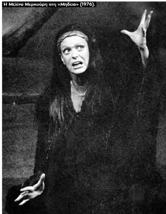
Η Μελίνα Μερκούρη στη «Μηδεια» (1976).

και η φιλοξενία για δύο χρόνια (2007 και 2008) των εκδηλώσεων του Ευρωπαϊκού Βραβείου Θεάτρου αποτέλεσε σημαντική συμβολή στην αναζωογόνηση της καλλιτεχνικής ζωής της Θεσσαλονίκης, αλλά και πόλο έλξης για καλλιτέχνες, δημοσιογράφους και θεατές από την Ελλάδα και το εξωτερικό.