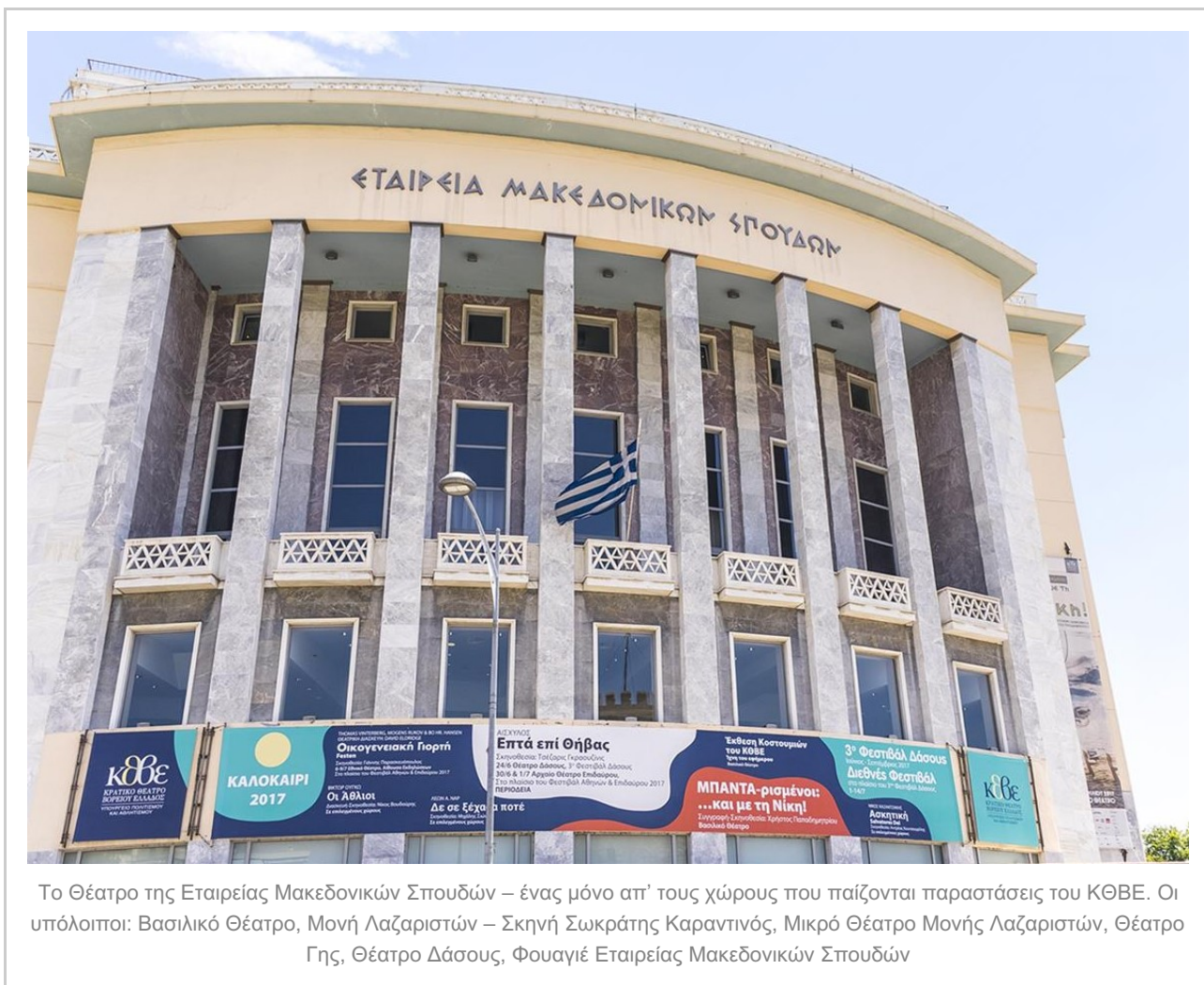
Το Θέατρο της Εταιρείας Μακεδονικών Σπουδών – ένας μόνο απ’ τους χώρους που παίζονται παραστάσεις του ΚΘΒΕ. Οι υπόλοιποι: Βασιλικό Θέατρο, Μονή Λαζαριστών – Σκηνή Σωκράτης Καραντινός, Μικρό Θέατρο Μονής Λαζαριστών, Θέατρο Γης, Θέατρο Δάσους, Φουαγιέ Εταιρείας Μακεδονικών Σπουδών